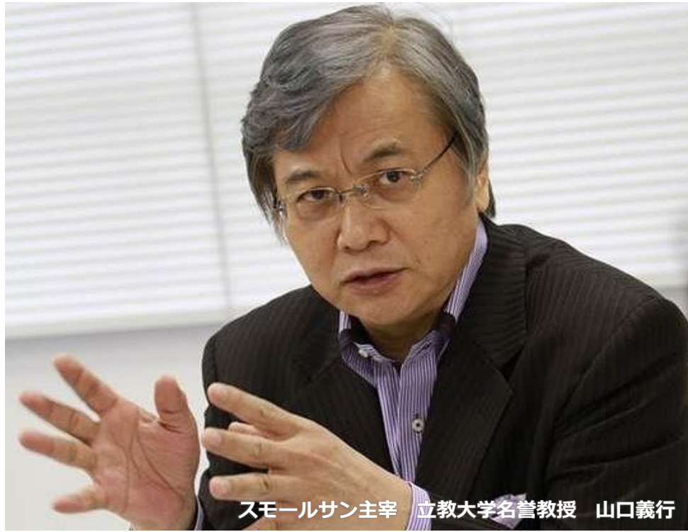
スモールサン主宰 立教大学名誉教授 山口義行