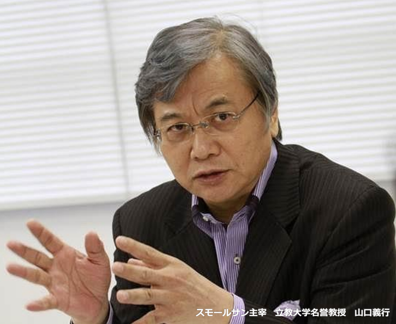
スモールサン主宰 立教大学名誉教授 山口義行