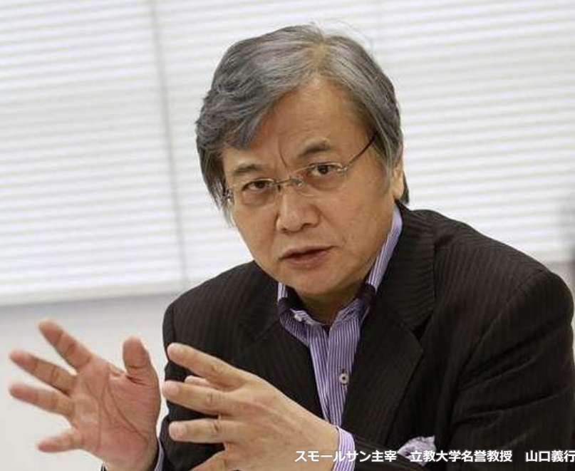
スモールサン主宰 立教大学名誉教授 山口義行