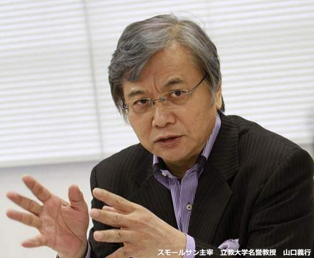
スモールサン主宰 立教大学名誉教授 山口義行